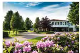
GC BRUNSTORF Ein golfertisches Prachtstück, rund 30 Minuten östlich von Hamburg gelegen