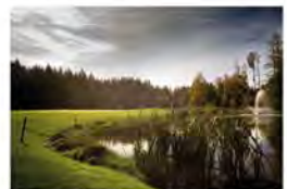
GC NATIONALPARK BAYERISCHER WALD 18 malerische Bahnen in Deutschlands erstem Nationalpark