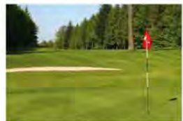
GC SPESSART Reizvolle Oase der Ruhe, hoch über dem Tal der Kinzig gelegen