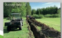
Drainage Bahn 10