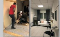
Umkleide vorher Umkleide nachher

in den letzten Wochen hat sich einiges in unserem Golfclub bewegt: ein Biergarten wurde angelegt, um den Corona-Auflagen zu entsprechen. Auf Bahn 10 wurde eine Drainage gebaut, die Damenumkleide wurde generalsaniert und die Bunker, die in den letzten Wochen sehr geliebt haben, wurden von Pflanzen befreit.